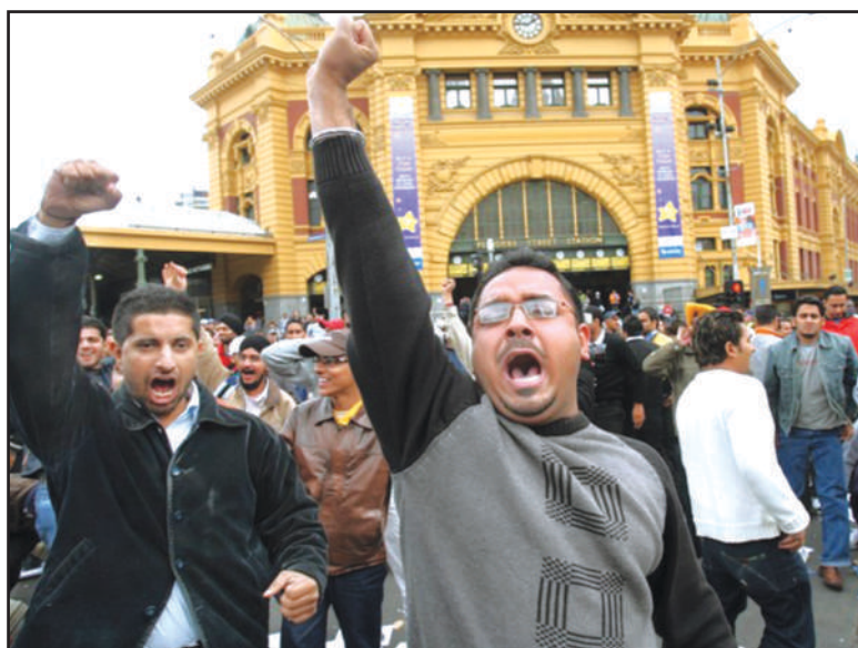
ਮੈਲਬਾਰਨ ਦੇ ਰਲਵੇਂ ਸਟੇਸ਼ਨ ਤੇ ਮੁਜ਼ਾਹਿਰਾ ਕਰਦੇ ਭਾਰਤੀ ਵਿਦਿਆਰਥੀ ।