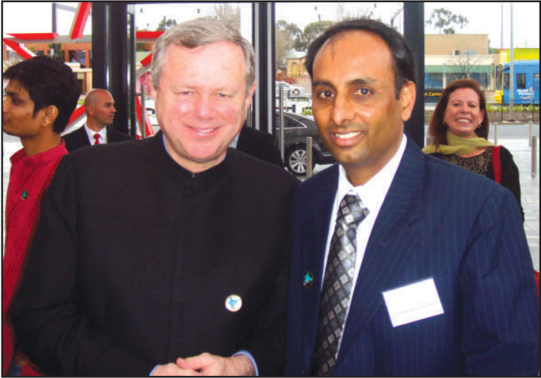
ਸਾਊਥ ਆਸਟ੍ਰੇਲੀਆ ਦੇ ਸਾਬਕਾ ਪ੍ਰੀਮੀਅਰ ਮਾਨਯੋਗ ਮਾਇਕ ਰੈਨ ਨਾਲ ਲੇਖਕ