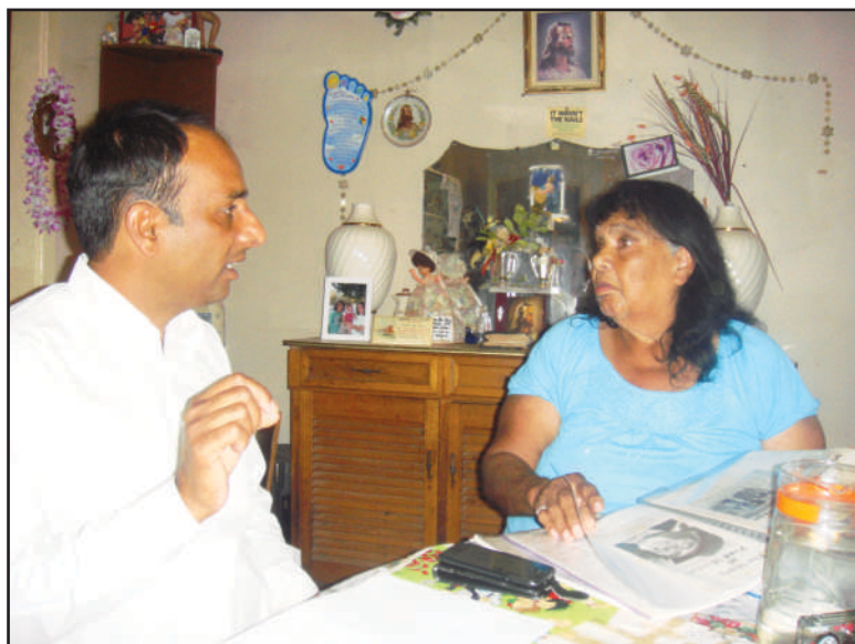
ਆਸਟ੍ਰੇਲੀਆ ਦੀ ਮੂਲ ਆਦਿ-ਵਾਸੀ ਮਹਿਲਾ ਨਾਲ ਇਤਿਹਾਸ ਫੋਲਦਿਆਂ ਲੇਖਕ