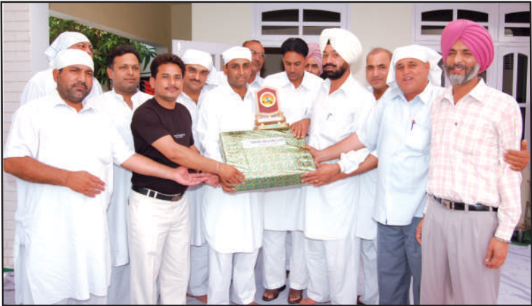
ਸਹਾਰਾ ਕਲੱਬ ਕਾਲਾਂਵਾਲੀ ਦੇ ਮਿੱਤਰਾਂ ਨਾਲ ਆਸਟ੍ਰੇਲੀਆ ਪਲਾਇਨ ਕਰਨ ਤੋਂ ਪਹਿਲਾਂ ਲੇਖਕ