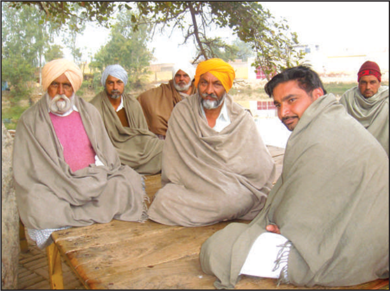
ਲੇਖਕ ਦੇ ਜੱਦੀ ਪਿੰਡ ਦੇਸੁ ਮਲਕਾਨਾ ਪਿੰਡ ਦੀ ਸੱਥ ਦੀ ਫੋਟੋ