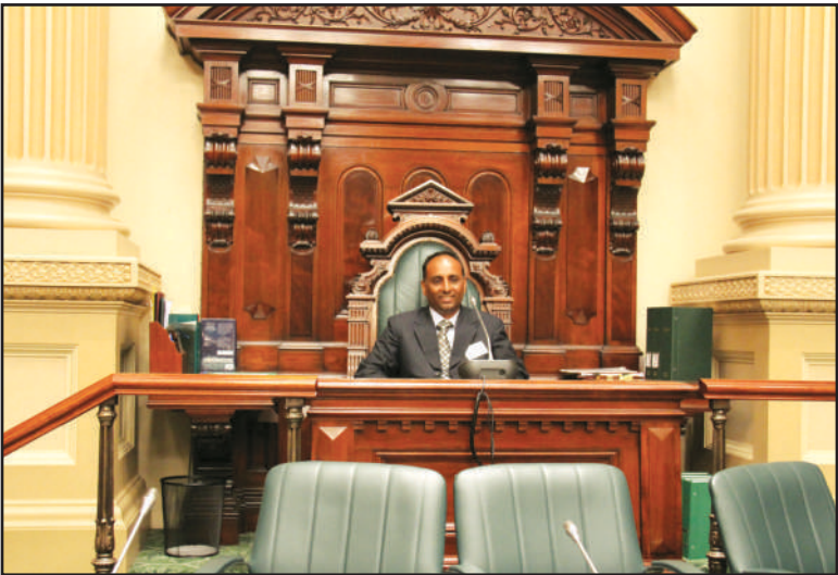
ਸਾਊਥ ਅਸਟ੍ਰੇਲੀਆ ਦੇ ਉੱਪਰਲੇ ਸਦਨ ਚ ਸਪੀਕਰ ਦੀ ਕੁਰਸੀ ਨਾਲ ਲੇਖਕ ਦੀ ਨਿੱਕੀ ਜਿਹੀ ਇਕ ਸਾਂਝ