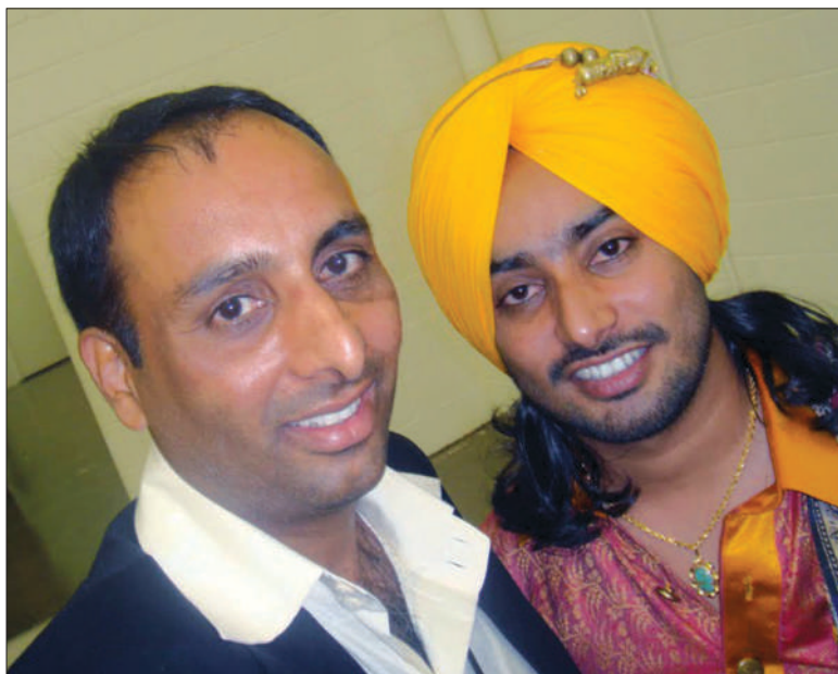
ਉੱਘੇ ਗਾਇਕ ਸਤਿੰਦਰ ਸਰਤਾਜ ਨਾਲ ਲੇਖਕ