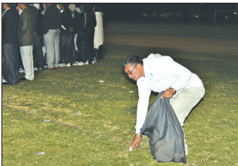
ਗ੍ਰਿਫਥ ਖੇਡਾਂ ਦੌਰਾਨ ਸਤੀਸ਼ ਚੰਦਰ ਮੈਦਾਨ ਦੀ ਸਫਾਈ ਦੀ ਸੇਵਾ ਕਰਦੇ ਹੋਏ