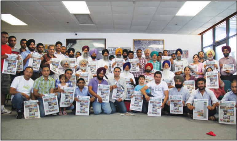
ਸਾਊਥ ਆਸਟ੍ਰੇਲੀਆ ਦਾ ਪਹਿਲਾ ਪੰਜਾਬੀ ਭਾਸ਼ਾ ਦਾ ਅਖਬਾਰ ਪੰਜਾਬੀ ਅਖਬਾਰ ਦੇ ਅਗਾਜਿ ਤੇ ਪਤਵੰਤਿਆਂ ਨਾਲ ਲੇਖਕ