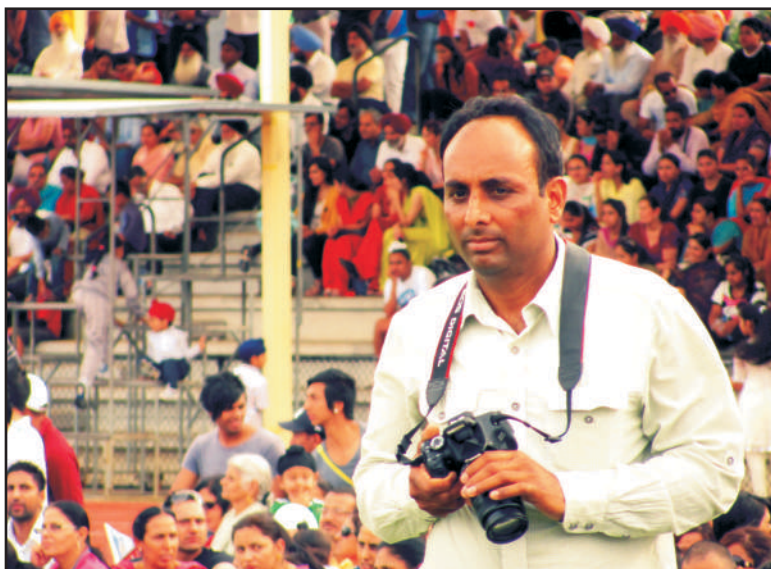
ਮੈਲਬਰਨ ਸਿੱਖ ਖੇਡਾਂ ਦੌਰਾਨ ਲੇਖਕ ਦੀ ਇਕ ਤਸਵੀਰ