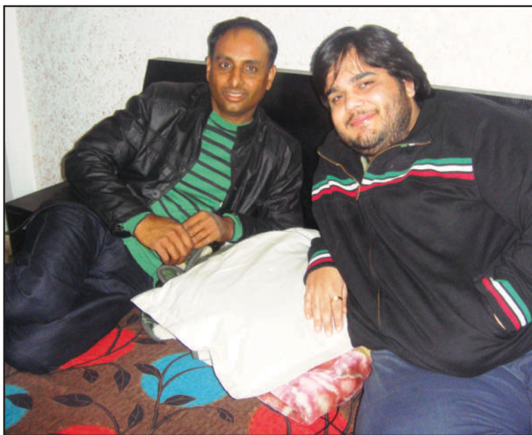
ਉੱਘੇ ਸੰਗੀਤਕਾਰ ਸਚਿਨ ਅਹੂਜਾ ਨਾਲ ਲੇਖਕ ਦੀ ਯਾਦਗਾਰੀ ਤਸਵੀਰ