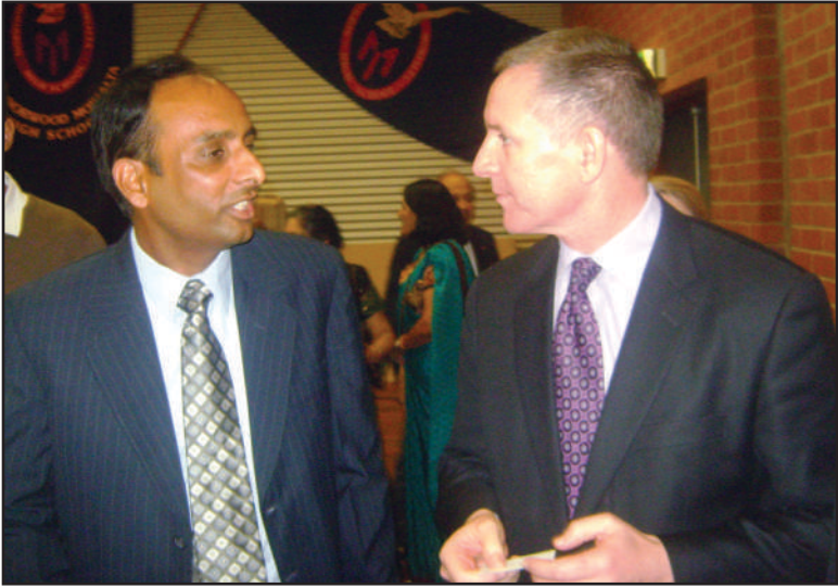
ਸਾਊਥ ਆਸਟ੍ਰੇਲੀਆ ਦੇ ਪ੍ਰੀਮੀਅਰ ਮਾਨਯੋਗ ਜੈ ਵੈਦਰਲ ਨਾਲ ਲੇਖਕ