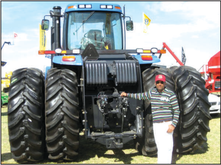
ਰਿਵਰਲੈਂਡ ਸਾਊਥ ਆਸਟ੍ਰੇਲੀਆ ਵਿਚ ਲਗਦੇ ਕਿਸਾਨ ਮੇਲੇ ਦੀ ਇਕ ਝਲਕ