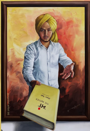
Painting Courtesy: Gurpreet Artist Bathinda

ਜੇ ਪੂਰਾ ਕਰਨਾ ਖੁਆਬਾਂ ਨੂੰ ਤਾਂ ਰੱਖਿਓ ਨਾਲ ਕਿਤਾਬਾਂ ਨੂੰ ਕਿ = ਕਿਰਦਾਰ ਤਾ = ਤਾਕਤ ਬ = ਬਰਾਬਰਤਾ